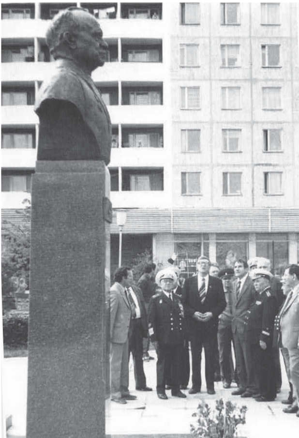
Сергей Горшков знакомится с бронзовым бюстом работы Льва Кербеля. Коломна, 28 июля 1984 года.

А поскольку дважды награжденным медалью «Золотая Звезда Героя» положено сооружать бронзовый бюст на Родине, то у меня возник вопрос: где будет этот бюст? В Каменце-Подольском, на Западной Украине, где он родился, или в Коломне, где провел большую часть своего детства? А так хотелось бы, чтобы у нас!