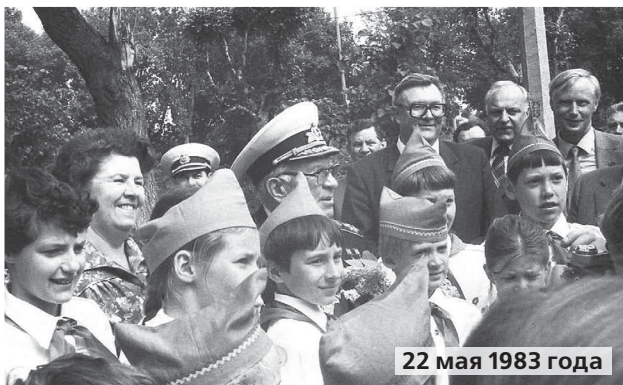
22 мая 1983 года