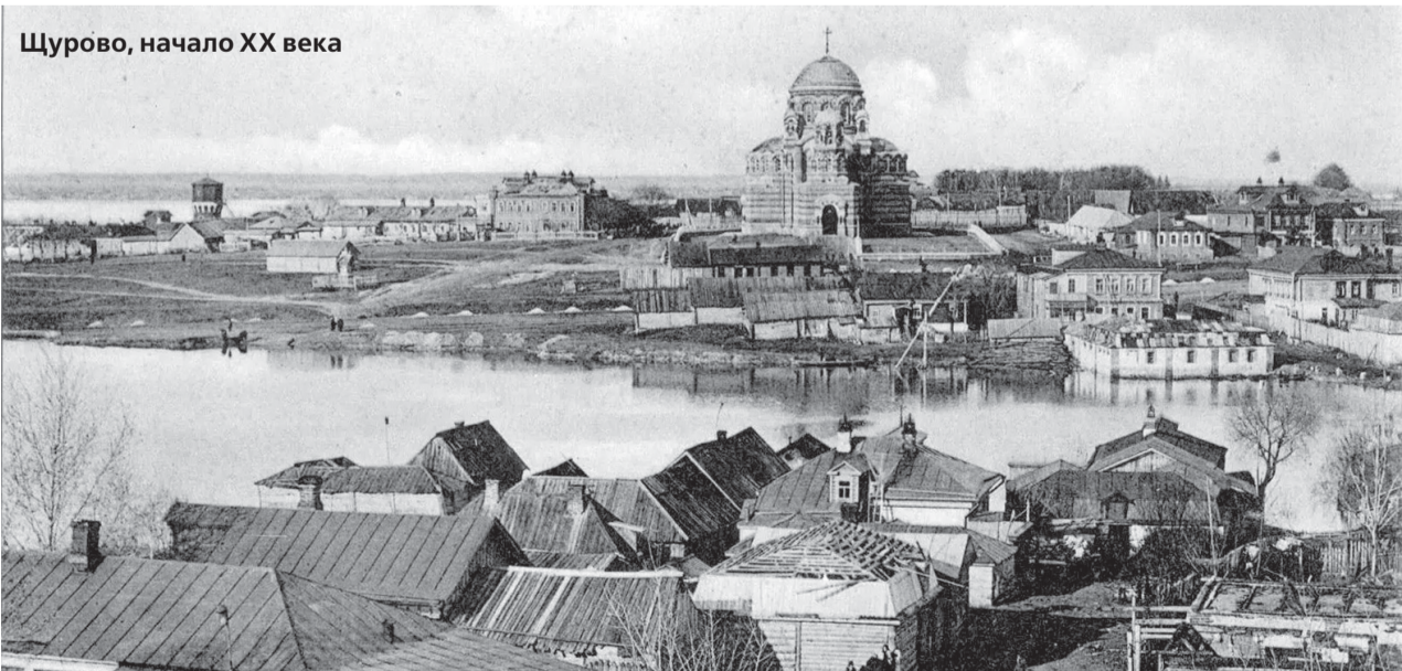
Щурово, начало XX века

Для публикации использованы материалы кандидата исторических наук Е. Ломако и книга В. Ярхо «Три времени Щурова»