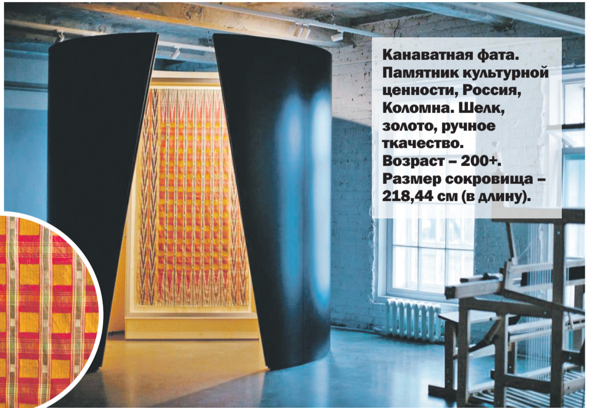
Фата экспонируется под музыку А. Шнитке «Признание в любви»

Канаватная фата. Памятник культурной ценности, Россия, Коломна. Шелк, золото, ручное ткачество. Возраст — 200+. Размер сокровища — 218,44 см (в длину).