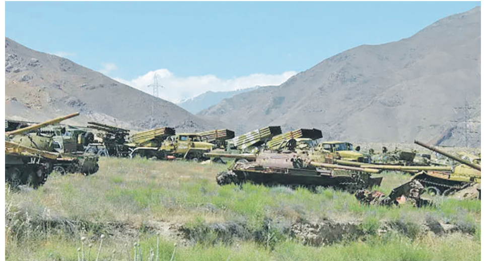
Война в Афганистане длилась с 1979 по 1989 год. В боевых действиях участвовали 500 коломенцев, 29 из них погибли.

Она строится так, чтобы противник попал как бы в мешок. Они оборудовали огневые точки на возвышенностях, прятали пулеметы за камнями. Я несколько раз попадал с однополчанами в засады, чудом удавалось вырваться. На глазах гибли товарищи. Но своих никогда не бросали – ни раненых, ни мертвых, всегда забирали с собой.