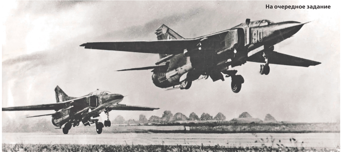
На очередное задание