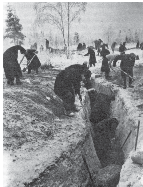
Жители Ленинграда роют окопы на подступах к городу.