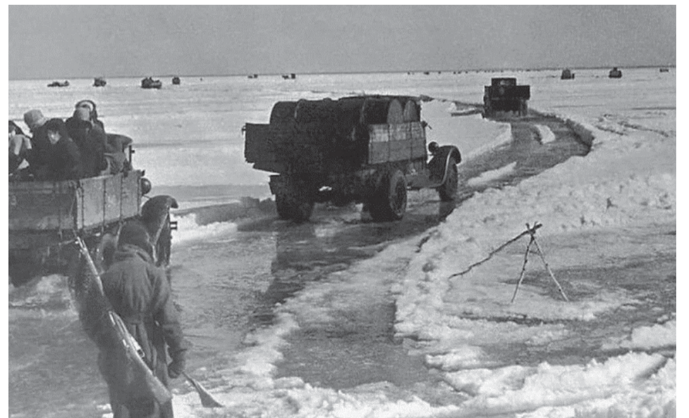
Грузовые автомобили вывозят людей из блокадного Ленинграда по подтаявшему льду Ладожского озера.

И в ночи январской беззвездной, Сам дивясь небывалой судьбе, Возвращенный из смертной бездны, Ленинград салютует себе!