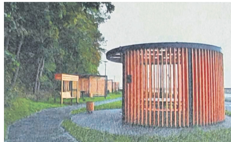
Эскизное предложение по благоустройству территории у прудов в Щурове.

тив оборудовать спуски к воде деревянными пирсами, чтобы можно было посидеть и полюбоваться пейзажем, а также установить на берегах беседки. Прозвучало предложение создать входную группу со стороны улицы Цементников. Но речь идет не об установке забора вокруг прудов, а лишь об оформлении центрального входа, чтобы было понятно, что это зона отдыха, и на ее территорию не проезжали машины. Также жители попросили администрацию закрепить за ней дворников, которые смогут регулярно поддерживать чистоту и порядок у водоемов. Все озвученные предложения внесли в протокол, и они должны быть учтены при разработке проектной документации.