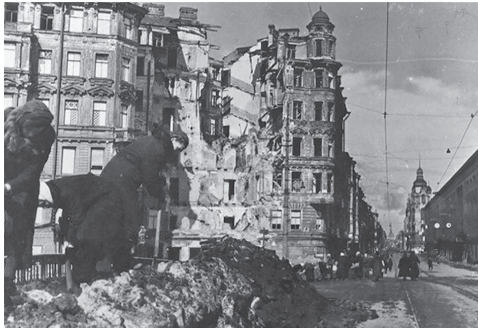
Набережная Фонтанки и дом 127, разрушенный немецкой авиабомбой 6 ноября 1941 года.