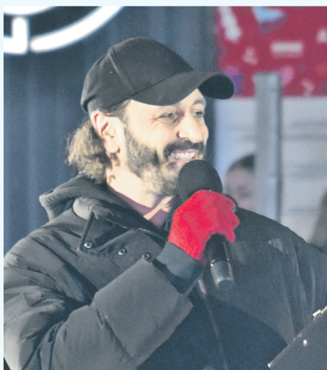
Илья Авербух, чемпион мира и Европы в танцах на льду:

«Я благодарю всех зрителей, которые нас очень сильно поддерживали. Сегодня прекрасная погода. Очень благодарен команде губернатора за то, что появляются новые катки. На коломенском льду мы завершаем череду наших выступлений, их было десять. И я надеюсь, что в следующем году – пятом, юбилейном – мы вновь вернемся в Коломну».