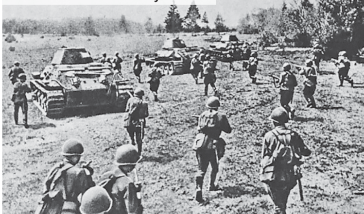
Советские войска в наступлении

Город Ржев был освобожден 3 марта 1943 года войсками 30-й армии Западного фронта. Из 20 тысяч человек, оказавшихся в оккупации, в день освобождения осталось чуть более 200 человек.