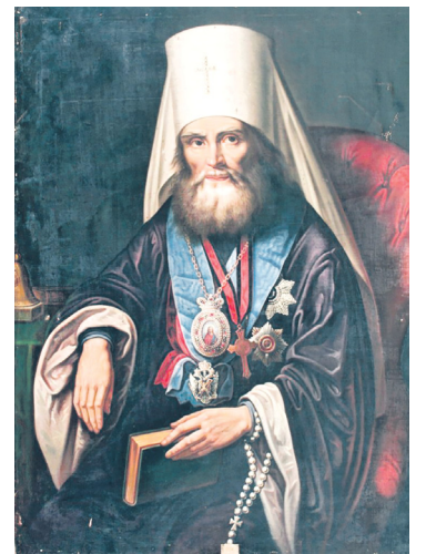
Филарет, митрополит Московский и Коломенский (Василий Михайлович Дроздов)