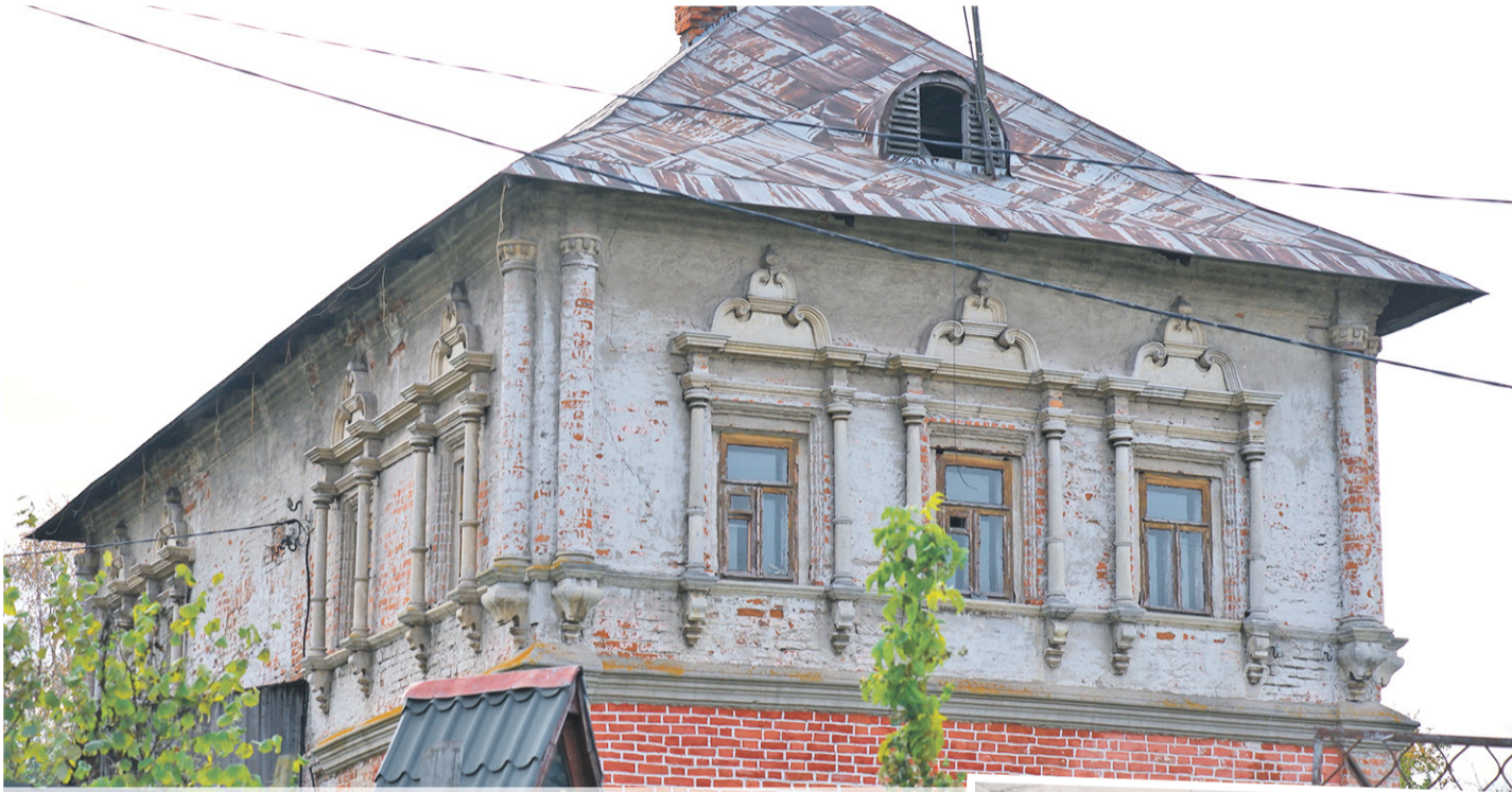
Дом воеводы является объектом культурного наследия федерального значения. Здание является древнейшим из известных гражданских сооружений Коломны.

ДОМ ВОЕВОДЫ – ТАК В НАРОДЕ НАЗЫВАЮТ СТАРИННОЕ ЗДАНИЕ, РАСПОЛОЖЕННОЕ В ПОСАДСКОМ ПЕРЕУЛКЕ ПОД НОМЕРОМ 13. ЖИЛЫЕ ПАЛАТЫ БЫЛИ ПОСТРОЕНЫ ПРИМЕРНО НА РУБЕЖЕ XVII–XVIII ВЕКОВ В СЕВЕРО-ВОСТОЧНОЙ ЧАСТИ КОЛОМЕНСКОГО ПОСАДА. НЕБОЛЬШОЕ КИРПИЧНОЕ ЗДАНИЕ НА ВЫСОКОМ ПОДКЛЕТЕ, ПОЗДНЕЕ ПЕРЕСТРОЕННОМ В ЦОКОЛЬНЫЙ ЭТАЖ, С ВЫСОКОЙ КРОВЛЕЙ И ТРЕХЧАСТНОЙ ПЛАНИРОВОЧНОЙ СХЕМОЙ СТОИТ УЖЕ БОЛЕЕ 300 ЛЕТ И СЧИТАЕТСЯ САМЫМ СТАРЫМ ГРАЖДАНСКИМ ЗДАНИЕМ ГОРОДА. КЕМ ОНО БЫЛО ПОСТРОЕНО? КАК УДАЛОСЬ СОХРАНИТЬ УНИКАЛЬНОЕ ЗДАНИЕ? А ГЛАВНОЕ, ПРИ ЧЕМ ЗДЕСЬ ВОЕВОДА?