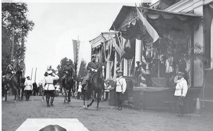
Николай II на станции Коломна, 1904 год

Император прибыл поездом, встречали его на станции Коломна. Среди делегации встречавших были московский губернатор, городской голова, духовенство, дворяне, представители купечества, земства, лучшие рабочие Коломенского завода. Чуть подалее стояли остальные граждане, пришедшие