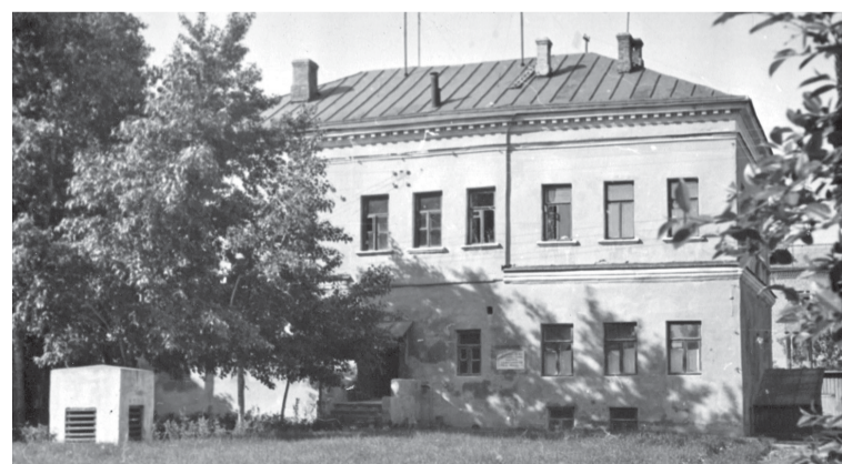
Главный дом усадьбы Лажечникова, 1968 год. В начале XX века в усадьбе располагалась первая городская библиотека им. И.И. Лажечникова. После 1917 года усадебные постройки были перепланированы под коммунальные квартиры. К 1950-м годам в главном доме и флигеле проживали около 40 человек.

То, что Лажечников — автор «Ледяного дома», знают все (ну, или почти все). Что его называли «русским Вальтером Скоттом» — тоже. А вот то, что писательство было не главным его занятием, известно не каждому. Между тем Иван Иванович после войны 1812 года сделал вполне успешную карьеру чиновника, дослужившись до вице-губернатора. В Коломне после этого он так и не жил, перемещался по городам, в которых получал назначение: Пензе, Каза-