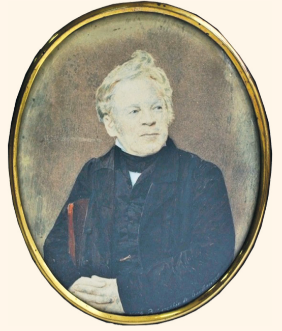
Свою первую фотографию Лажечников сделал в 60 лет. Самый ранний снимок выполнен К. Даутендеем в начале 1850-х годов.