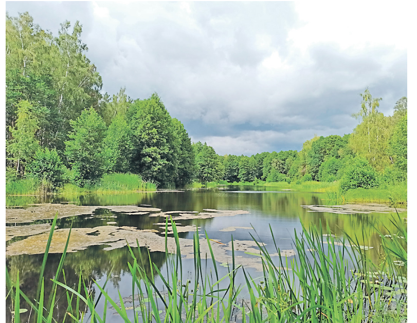
Тело несчастной пенсионерки сбросили в водоем.

По уголовному делу проведен большой объем следственных действий: более 20 допросов, 15 экспертиз, среди которых дактилоскопическая, молекулярно-генетическая, биологическая и другие. Собранные доказательства и заключения экспертиз легли в основу обвинения. Уголовное дело передано в суд для рассмотрения по существу.