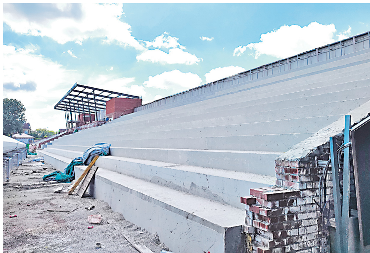
После обновления стадион сможет принимать соревнования всероссийского уровня и станет одной из лучших спортивных площадок Подмосковья.

с прыжковыми ямами и сектором для толкания ядра, построят беговые дорожки с новым покрытием и секцией для стипль-чеза (бега с препятствиями — прим. ред.). В центре стадиона разместится круглогодичное футбольное поле с искусственным газоном и подогревом. Его размеры составят 70 на 120 метров. Работы по подготовке поля завершены на 90%. Остается