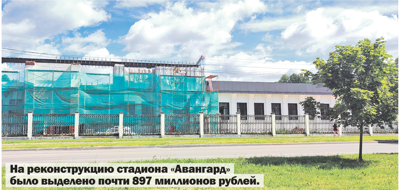
На реконструкцию стадиона «Авангард» было выделено почти 897 миллионов рублей.

Капитальный ремонт стадиона «Авангард» проводится в рамках губернаторской программы и продолжается уже почти полтора года — он был закрыт в феврале 2023-го. За это время был проведен большой объем работ по деконструкции, в частности, северной трибуны, которая была разобрана практически полностью. Сейчас здесь уже восстановили кирпичную кладку наружных и несущих стен, выполнили устройство монолитного покрытия и усиление проемов, сделали стяжку пола, вставили оконные блоки, смонтировали железобетонные перекрытия и стены ложи для СМИ. В настоящее время на северной трибуне выполняют работы по монтажу инженерных сетей, устройству вентилируемого фасада, гидроизоляции, строительству перегородок помещений трибуны с утеплением и шумоизоляцией. Впереди большой комплекс работ по внутренней отделке. На северной трибуне будут размещаться универсальный спортивный зал, ложа для СМИ на 114 мест, женские и мужские раздевалки, душевые, медицинский кабинет и другие вспомогательные помещения. Параллельно ведется реконструкция южной трибуны. До капремонта ее состояние было несколько лучше, чем северной, а потому работы здесь близки к завершению. Сейчас строители заняты оштукатуриванием потолков, стен и перегородок кабинетов и служебных помещений, в