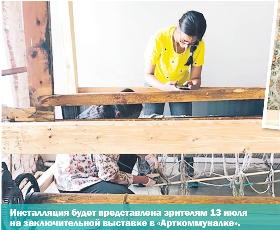
Инсталляция будет представлена зрителям 13 июля на заключительной выставке в «Арткоммуналке».

Две противоположности — два зонта, два купола, соединенных общей осью. Каждый купол покрыт