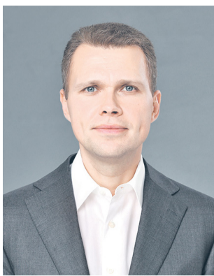
Депутат Государственной Думы Никита Чаплин