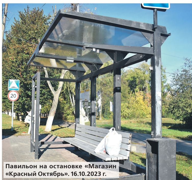
Павильон на остановке «Магазин «Красный Октябрь». 16.10.2023 г.

Замена одной секции обходится местному бюджету от 9 до 20 тысяч рублей.