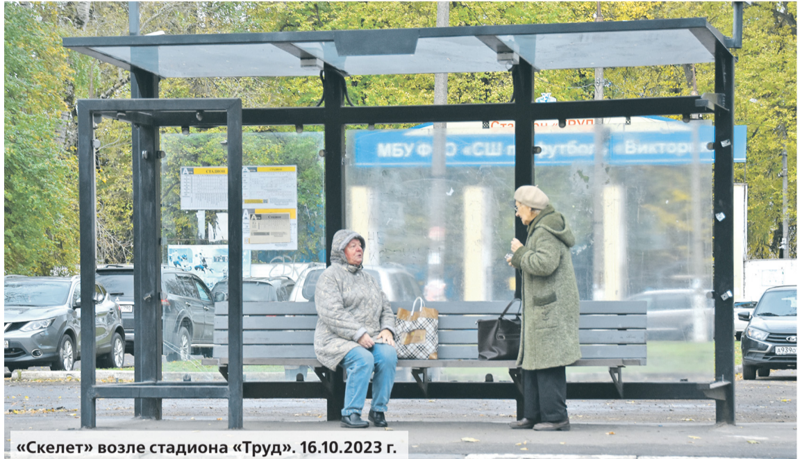
«Скелет» возле стадиона «Труд». 16.10.2023 г.

Некоторые остановки после «самовыражения» вандалов превращаются в «скелеты», в которых, кроме каркаса, почти ничего нет. О пользе таких сооружений говорить не приходится — они не могут защитить даже от морозящего дождя, не говоря уже о ветре, ливне или снегопаде. Примеры таких «скелетов» есть, например, на Окском проспекте. Остановочный павильон возле стадиона «Труд» уже давно оснащен естественной системой кондиционирования. Разбитыми остаются