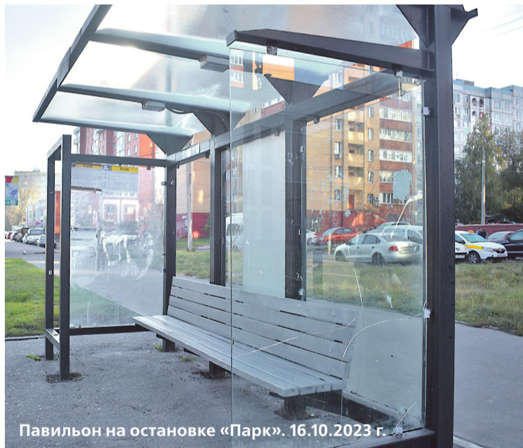
Павильон на остановке «Парк». 16.10.2023 г.

Замена одной секции обходится местному бюджету от 9 до 20 тысяч рублей.