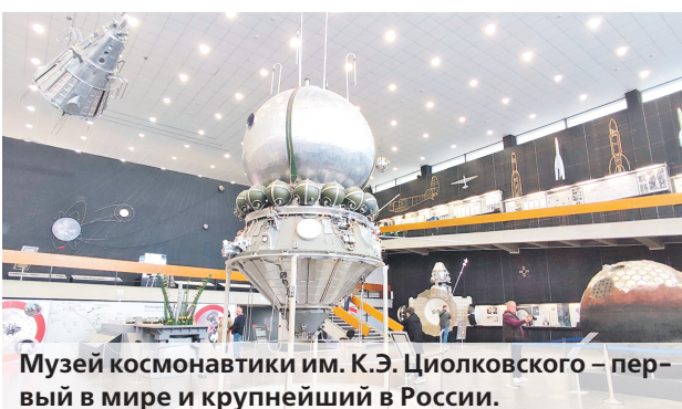
Музей космонавтики им. К.Э. Циолковского — первый в мире и крупнейший в России.

периментах и изобретениях, а также увидите мастерскую, где ученый проводил эксперименты, с выходом на крышу — там был установлен телескоп, в который он наблюдал за небом.