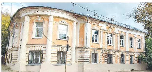
Лицо Старой Калуги определяют классицизм и ампир. В городе сохранилось много домов и усадеб XVIII–XIX веков.