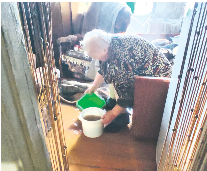
Квартиру пенсионерки затопило после подачи отопления.

Между тем сотрудники ООО «ДГХ» просят отнестись с пониманием к возможному временным перебоям, а также набраться терпения. Об этом они сообщают на своих информационных ресурсах. В сообщении, опубликованном на официальном