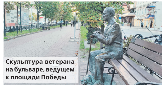
Скульптура ветерана на бульваре, ведущем к площади Победы

Можно записаться на обзорную экскурсию-квест «Калужские приключения». В процессе дети познакомятся с историей города и его главными достопримечательностями, которые сами нанесут на выданную им карту. Экскурсовод поведает вам городские легенды и откроет тайны — например, покажет дом с привидениями.