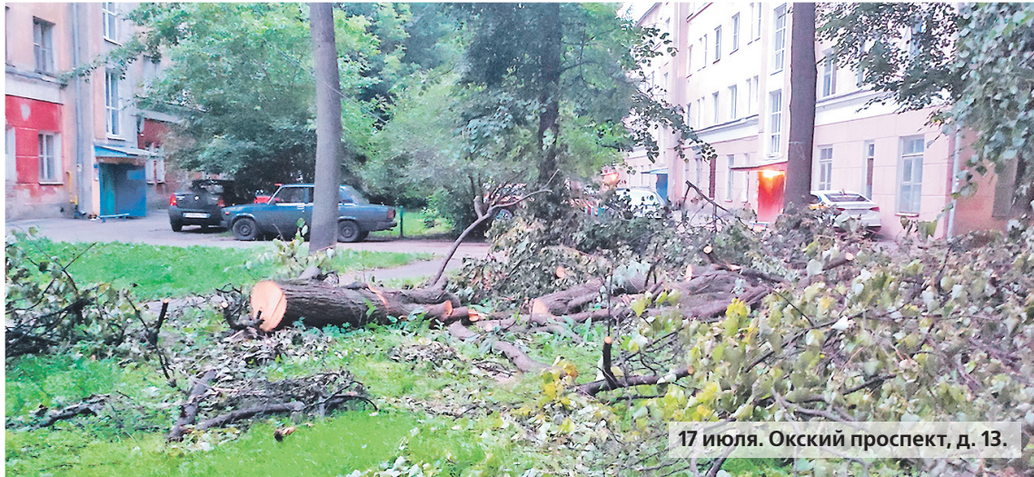
17 июля. Окский проспект, д. 13.

Если пройтись пешком по городу, можно насчитать не один десяток аналогичных дворов, где до сих пор лежат кучи ветвей или угрожающе свисают над головами поломанные стволы старых кленов и тополей. Картину постапокалипсиса дополняют дорожные знаки, которые до сих пор не приведены в порядок после бури и теперь вводят в заблуждение автомобилистов.