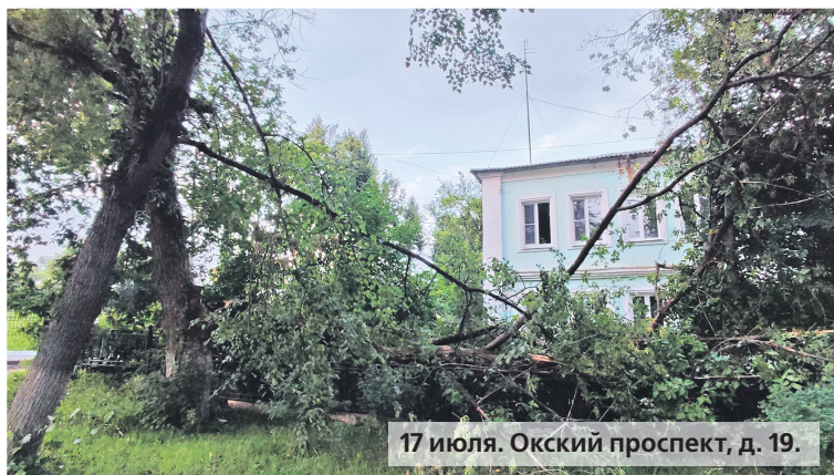
17 июля. Окский проспект, д. 19.

Досталось и паркам. Так, в Запрудском парке новые дорожки не выдержали испытание ливнями и пошли волной. Искусственное покрытие, пропитанное влагой, тоже сильно деформировалось, а местами начало проваливаться.