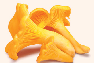
Самые крупные лисички растут в Калифорнии: вес одного гриба может достигать 500 граммов.

«Лисички чаще всего выдают две волны – в июне и в конце лета-осени (с августа по ноябрь). Это очень распространенный и высокоурожайный гриб, доля которого составляет до 20% от общей массы лесных грибов. Растут они чаще всего недалеко от ели, сосны, березы и дуба. Плодоносят такие грибы многочисленными группами, поэтому если увидели одну, ищите и остальные».