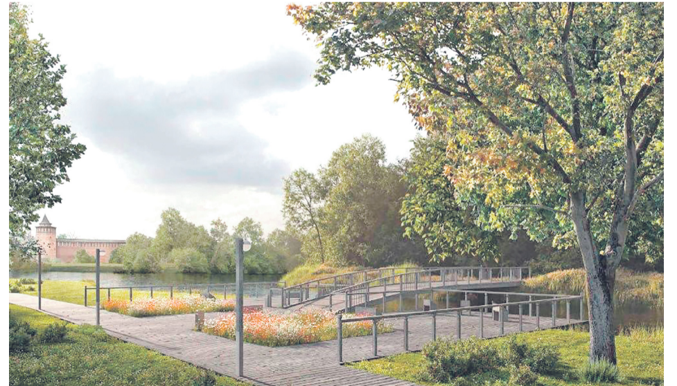
Фото из проекта благоустройства территории у берега Коломенки