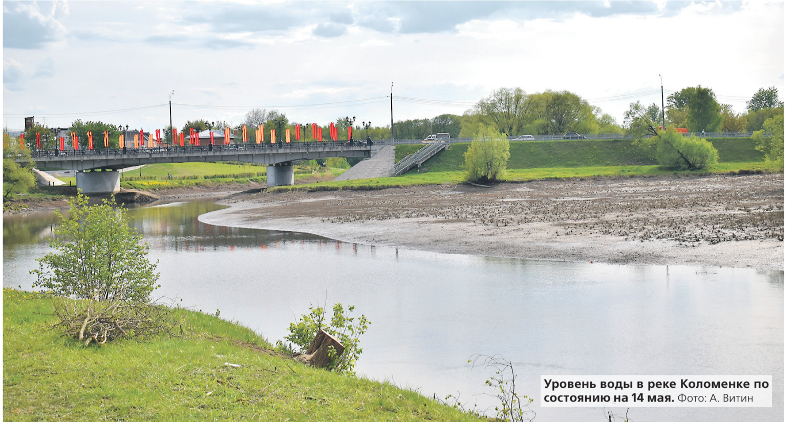
Уровень воды в реке Коломенке по состоянию на 14 мая.

Что касается работы пляжа, то, увы, вынуждены разочаровать. В этом году зону отдыха закроют для посещения. Это связано с предстоящим снижением уровня воды и необходимостью обеспечить безопасность граждан в период строительных работ. Предполагается, что капитальный ремонт плотины продлится полтора года и закончится лишь в сентябре 2024 года, а потому всем, кто любил купаться в Коломенке, придется выбирать другие городские