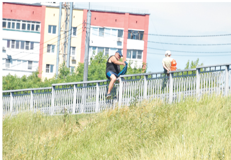
ЧЕРЕЗ ОГРАДУ. Поэтому большинство людей перелезает через ограду и идет привычной «народной тропой».