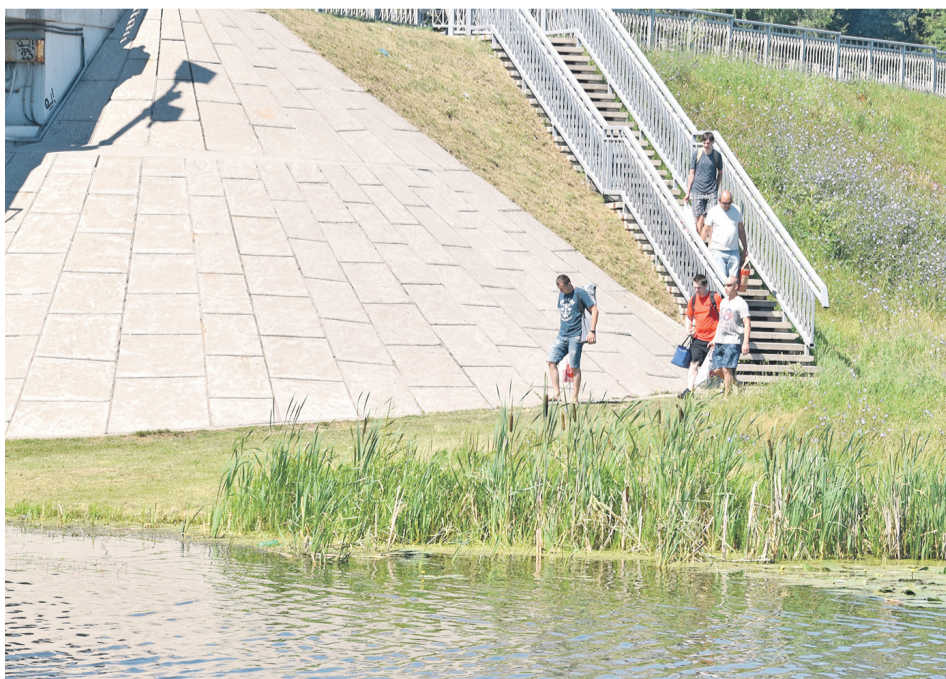
ПУТЬ к пляжу через лестницу и под мостом долг и труден...