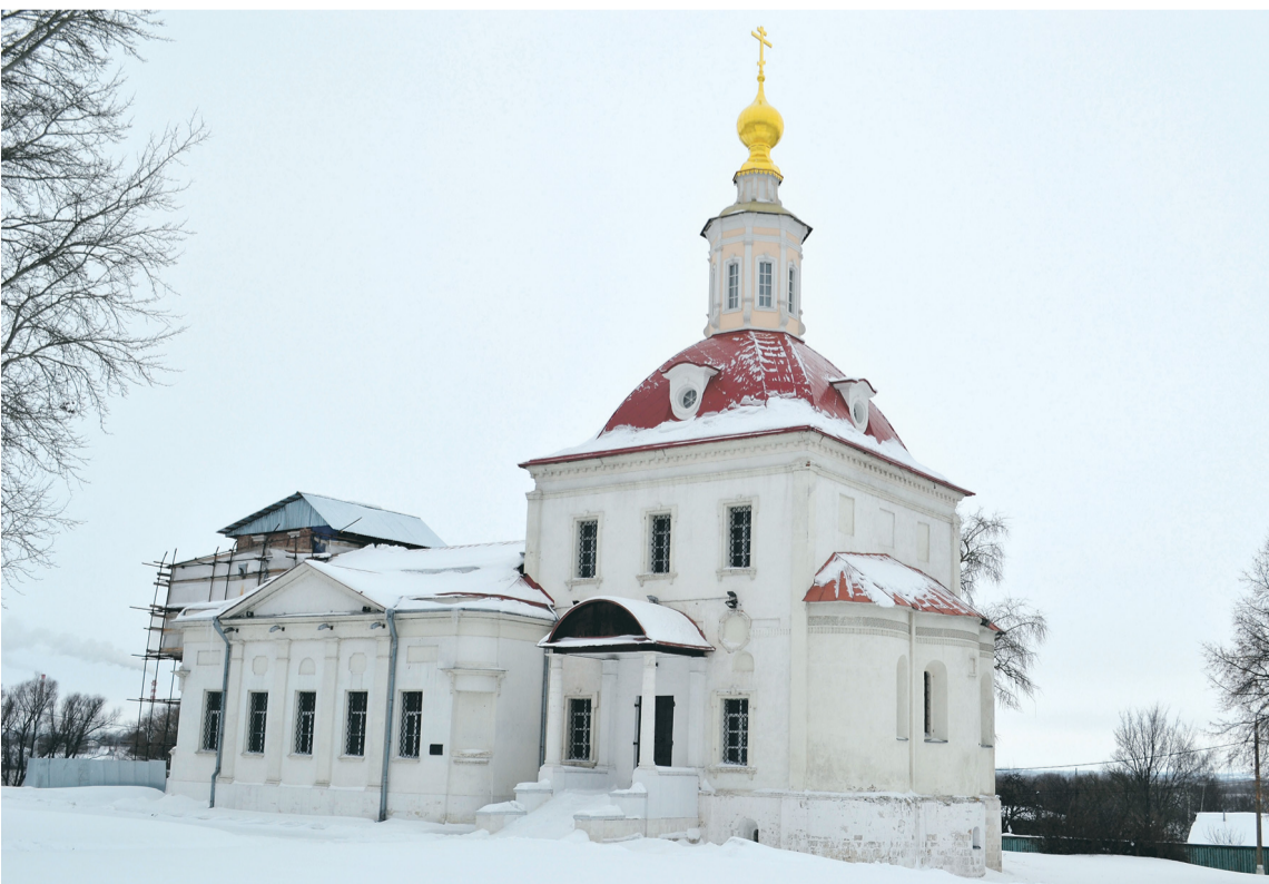
Храм Воскресения Словущего.