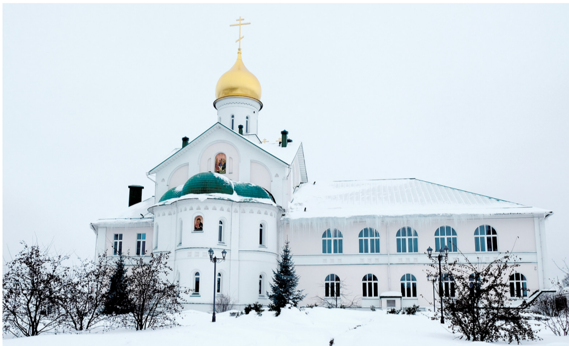
Богоявленский Голутвинский монастырь.

Благодарим за помощь в подготовке материала поэта, прозаика, церковного историка, литературоведа, переводчика Р. Славацкого