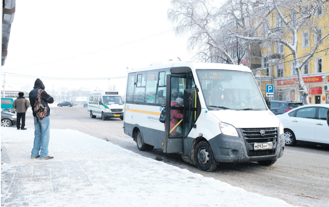
С ЯНВАРЯ 2019 г. изменился маршрут движения автобуса № 13, а теперь еще и порядок оплаты за проезд.

Напомним: изменения в движении автобусов по маршруту № 13 стали происходить с 1 января 2019 года. С этого времени бывшие маршрутки начали двигаться по расписанию, в них стали действовать льготы — это плюс. Но вместе с тем изменилась схема движения, а теперь еще и правила оплаты — и это уже минус. Отныне при посадке в микроавтобус на остановках, предшествующих конечной («Набережная» — прим. ред.), пассажирам придется еще раз оплатить проезд, чтобы следовать дальше.