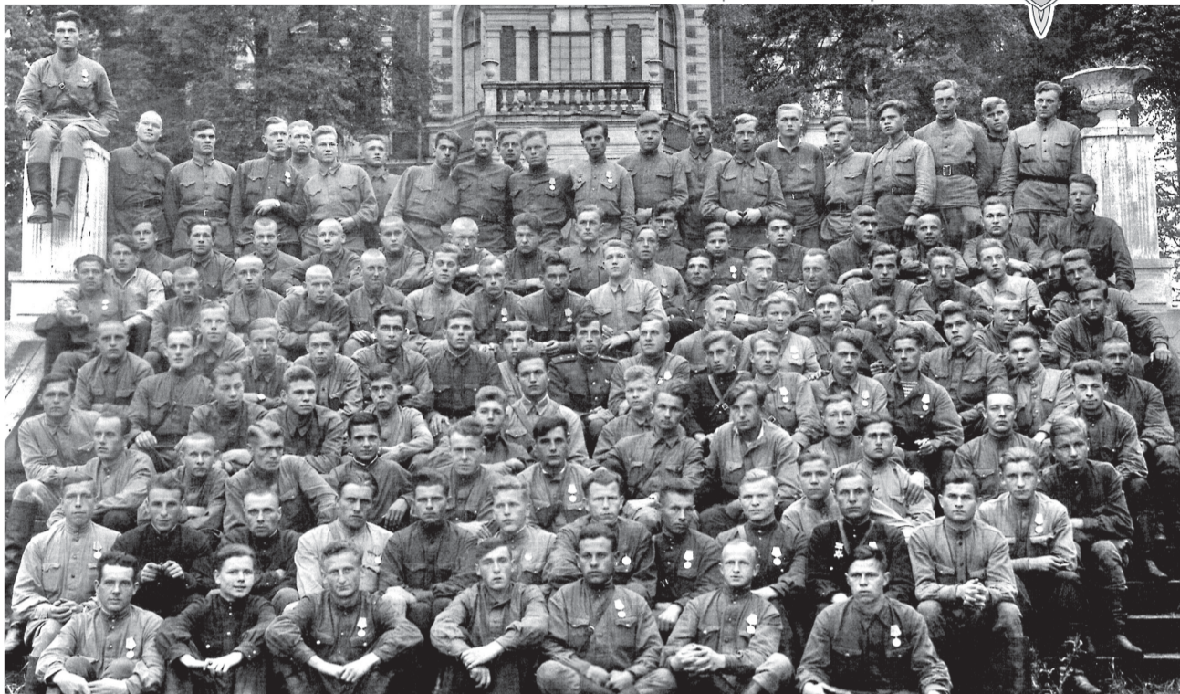
БОЙЦЫ-ДИВЕРСАНТЫ 88-го истребительного батальона УНКВД города Москвы и Московской области – спецшколы подрывников.

С июля 1998 по август 1999 года ФСБ возглавлял нынешний президент России Владимир Путин.