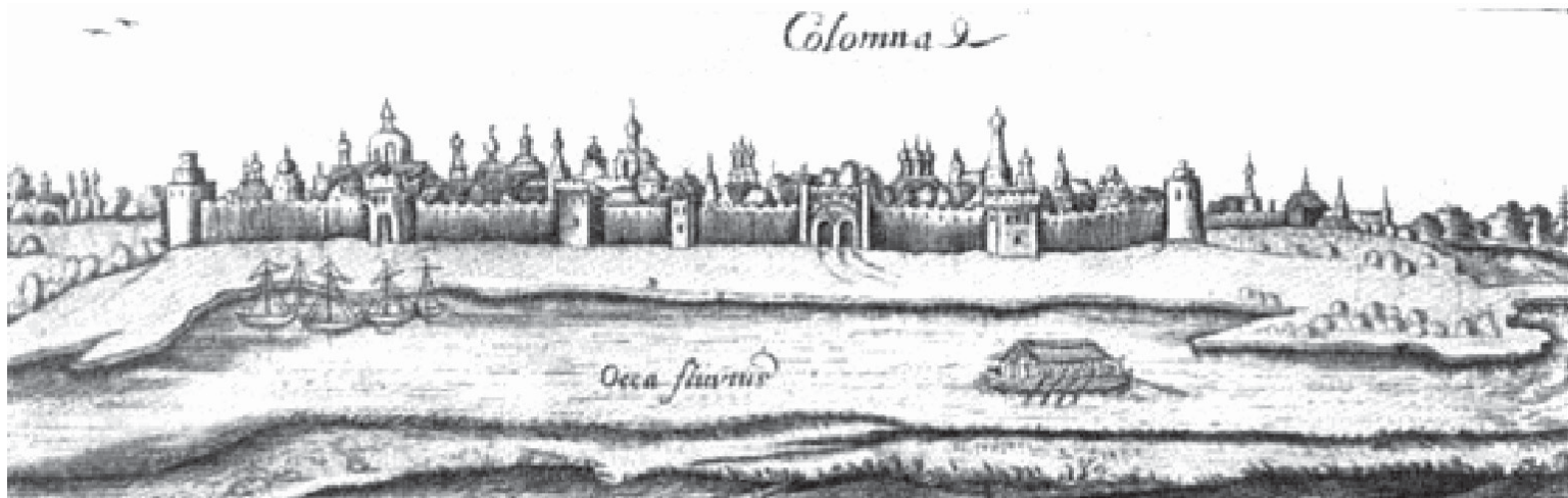
ОБЩИЙ вид Коломенского кремля. Гравюра XVII века.

В «Описании Московской губернии» сообщалось, что город делится на две большие части: « Сеи город разделяется рекою Коломенкою на две главные части, Городскою и Запрудною называемая; в рассуждении же строения главнейшая часть есть кремль, окруженный высокою каменною стеною, разделенною на 14 башен; в одной есть с