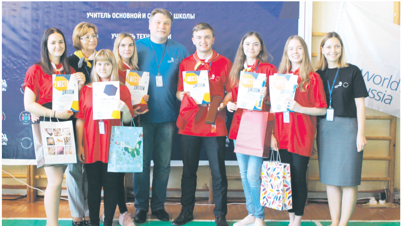
Межвузовский чемпионат WorldSkills Russia по компетенциям «учитель основной и средней школы» и «учитель технологии». Май 2018 года.

Еще одно важное условие для повышения мотивации студентов - педагогическая практика. Чем ее больше, тем лучше. У врачей есть ординатура и интернатура: сначала студенты-медики ходят на обход с профессором, потом их постепенно все ближе и ближе подпускают к телу пациента. Точно так же должно быть у учителей. Если раньше педпрактика начиналась с третьего курса, то теперь «погружать в профессию» начинают на первом. Вместо 18 недель студент проводит в шко-