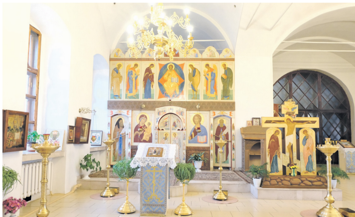
ЛЕВЫЙ придел храма во имя Трех Святителей.

Сейчас в Никольском храме отреставрировано зимнее помещение, планируется восстанавливать летнее. Сегодня в церковь святителя Николая приходит много прихожан, много людей приезжает из других сел. Для детей работает воскресная школа.