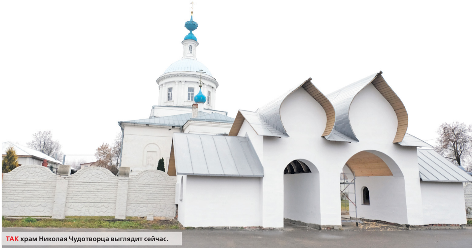
ТАК храм Николая Чудотворца выглядит сейчас.

Здесь же учили детей. Сначала, в 1840 году, открыли Пар-