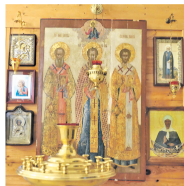
ИКОНА Трех Святителей.

их все любили. А те, кто жил в этой местности, практически все были их учениками».