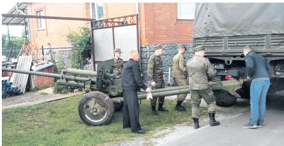
ЛЕТОМ 2018 ГОДА в Луховицах обнаружили и изъяли 57-миллиметровое противотанковое орудие образца 1941 года.