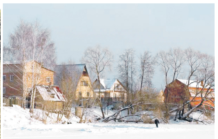
ДЕРЕВНЯ Новоселки сейчас выглядит так