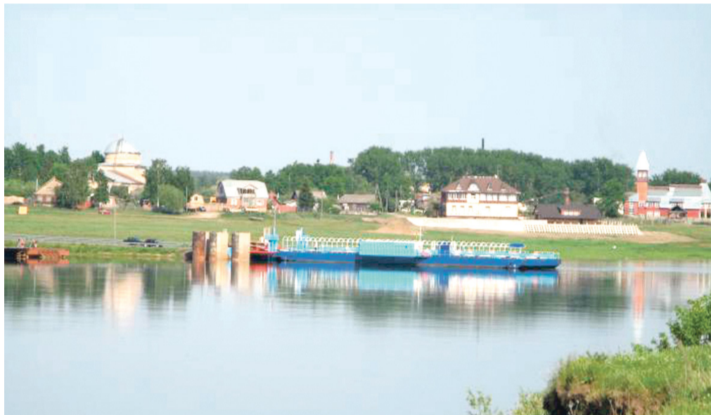
В ЭТОМ тихом местечке разыгралась кровавая драма.