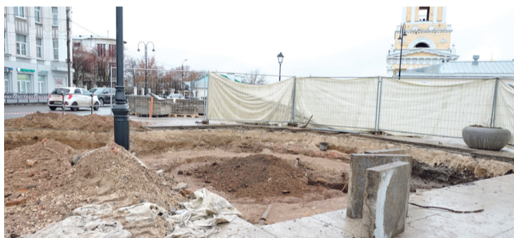
ФУНДАМЕНТ часовни, найденный в 2017 году, планируется открыть для обозрения.

стране: в деревне Семенцевой Вологодской губернии, Царевкокшайске Казанской губернии, в городе Рыбинске Ярославской губернии, селе Родня Тверской губернии, в городе Богородске Московской губернии и других. Такая часовня появилась и в Коломне. Место для святыни выбрали «на градской, так называемой Житной площади», архитекторам оно показалось «по грунту удобным, по положению же своему для часовни прилично». В 1869 году ее освятили в честь небесного покровителя императора — святого князя Александра Невского.