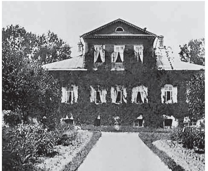
ДОМ в имении Новоселки, 1910-е годы