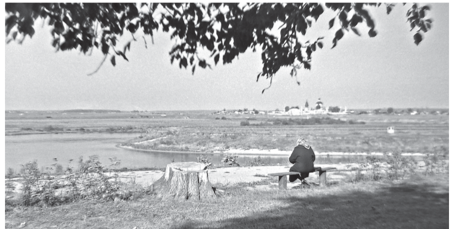
А ЭТО ПРОШЛОЕ Косого спуска и сквера «Блюдечко»

ревская, Бобреневская и Свиблова башни, а также Водяные ворота, расположенные в прясле стены. Одной из наиболее красивых башен Коломенского кремля была Свиблова. Ее еще называли Москворецкая, Стрельня, Мотасова, Круглая наугольная. Почему в исторических анналах она осталась именно как Свиблова? Скорее всего, ее название происходит от имени приближенного боярина Дмитрия Донского – Федора Андреевича Свибло. Существует предположение, что он мог принимать участие в строительстве стен деревянного Коломенского кремля.