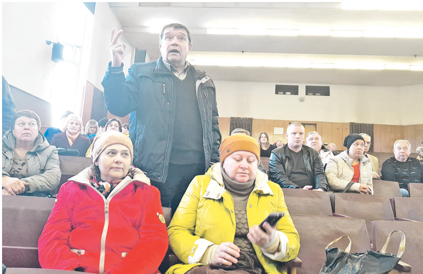
КОЛОМЕНЦЫ задавали острые вопросы относительно своего имущества, но получали расплывчатые ответы.

Однако ответы на столь острые вопросы звучали от представляющей генплан стороны очень расплывчато. Участникам слушаний было предложено еще раз написать письма и обращения, которые станут «поводом для дополнительного разбирательства», а также прийти на прием в администрацию для решения проблем в частном порядке.