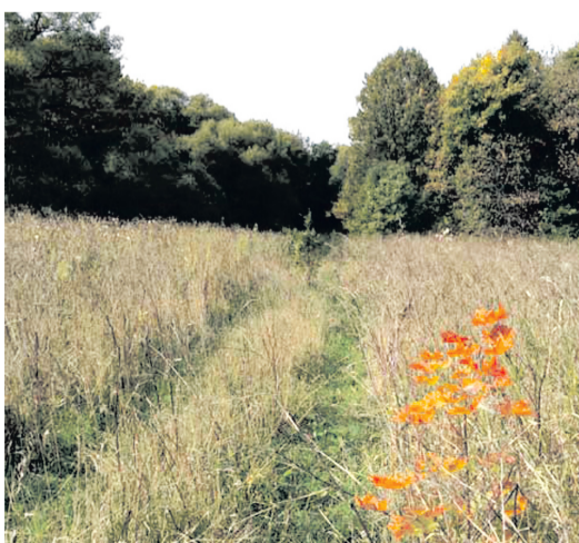
ПАРК имени Новоселки теперь заброшен

Подготовила Ольга ШЕВЫРЕВА По материалам публикации Владимира Енишерлова «Возвращение в Новоселки» (историко-культурный журнал «Наше Наследие», № 102, 2012). Благодарим за помощь в подготовке материала Е.Л. ЛОМАКО