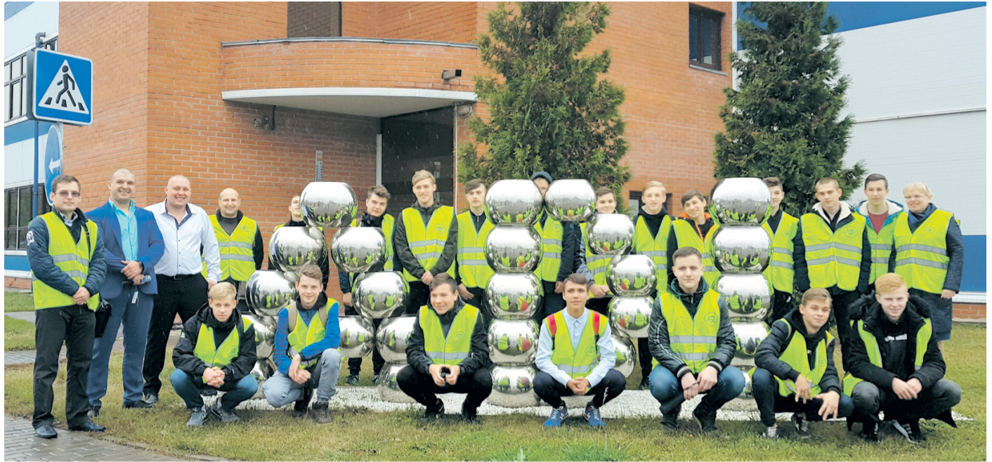
КОМПАНИЯ АДЛ тесно сотрудничает с учебными заведениями, в частности, с колледжем «Коломна», предоставляя студентам возможность проходить практику на предприятии с последующим трудоустройством.

Стремление к профессиональному росту в компании только поощряется, потому что слесари 2 разряда становятся бригадирами, мастерами, начальниками производства. Более того, все руководство компании АДЛ начало трудовой путь на предприятии именно с рабочих специальностей. А этот факт, согласитесь, вдохновляет на трудовые свершения!