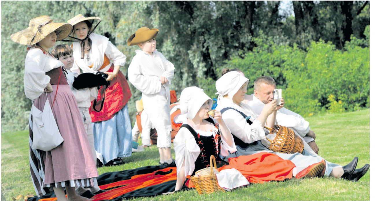
СЕЙЧАС на «Блюдечке» проходят исторические фестивали и городские праздники.

На левой стороне «Блюдечка» стояли Санды-