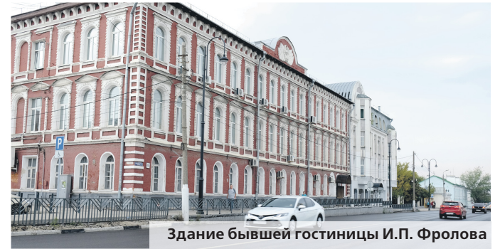
Здание бывшей гостиницы И.П. Фролова