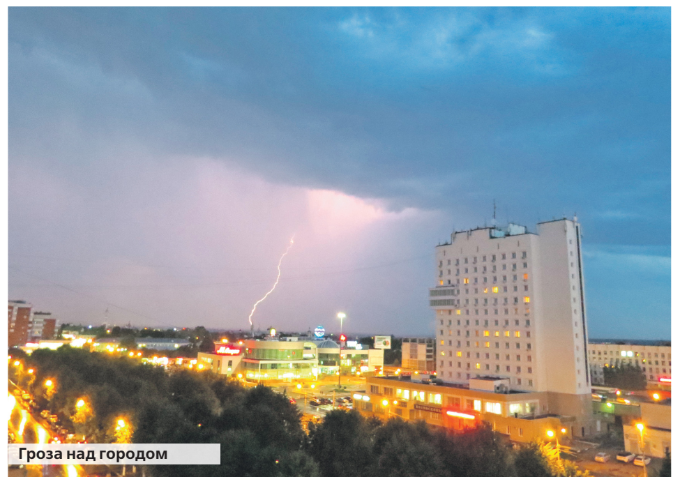
Гроза над городом