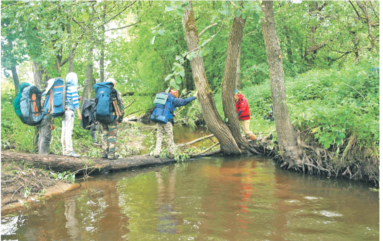
ВЕЛЕГУШКА недалеко от села Хорошово.

Небольшие реки, как правило, имеют славянские названия. Но и здесь не всегда сразу можно догадаться, почему река носит такое имя. Возьмем, например, название реки Алешенка. На первый взгляд, оно связано с уменьшительно-ласковой формой мужского имени Алеша. Но лингвист сразу скажет, что такой топонимической модели в нашей местности нет, иначе бы речки назывались бы Петрушка,