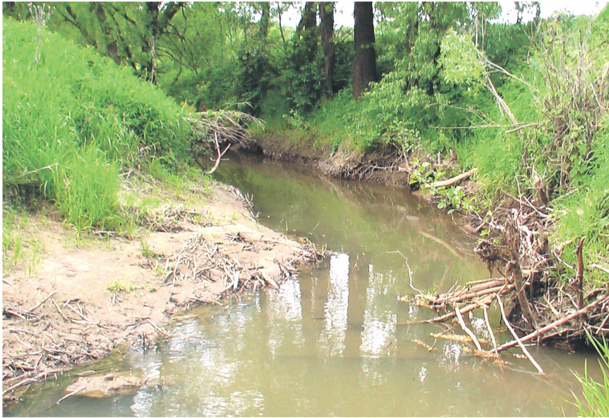
ШОЛОХОВКА в километре от устья.

Почему коломенские реки, речки, озера и пруды так называются? Можно отметить четкую закономерность: все названия