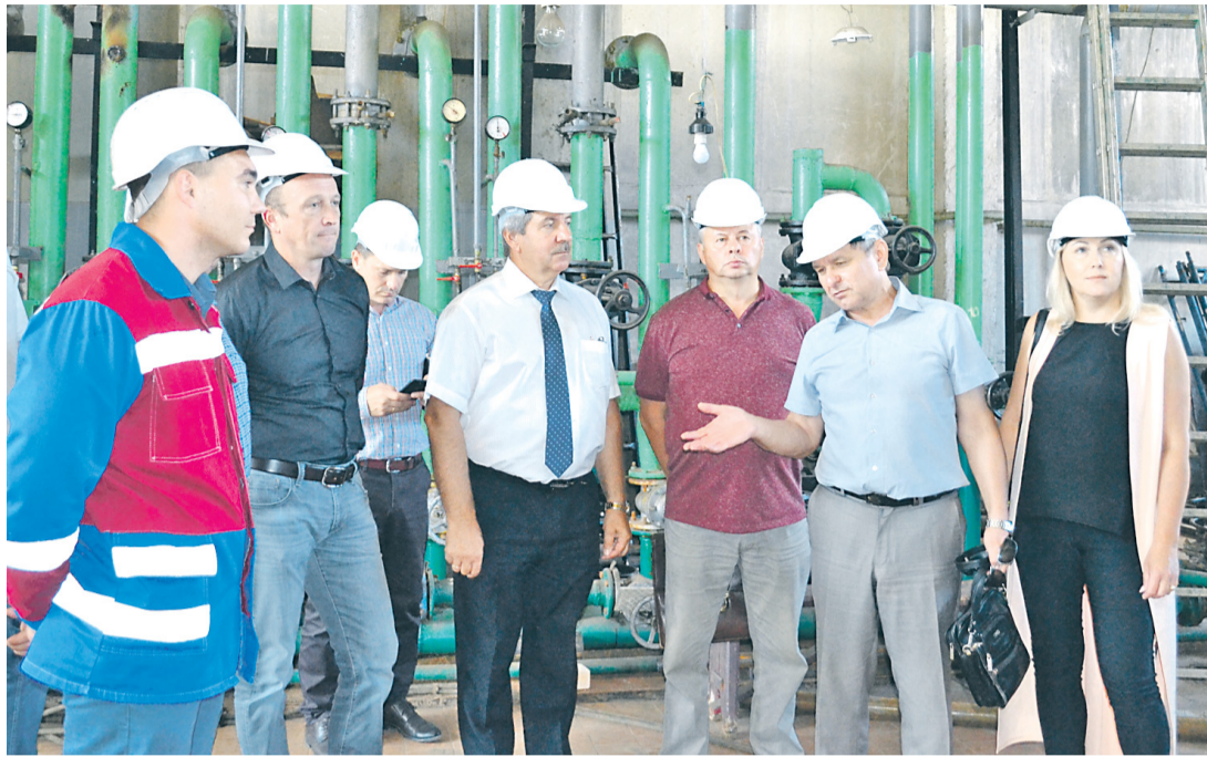
ДЕПУТАТЫ оценили готовность котельных к отопительному сезону.

Котельная будет работать в водогрейном режиме, что более безопасно, экономично и современно. Ее мощность сохранили на том же уровне, что и прежде. Котельную запустят к грядущему отопительному сезону, она обеспечит теплом