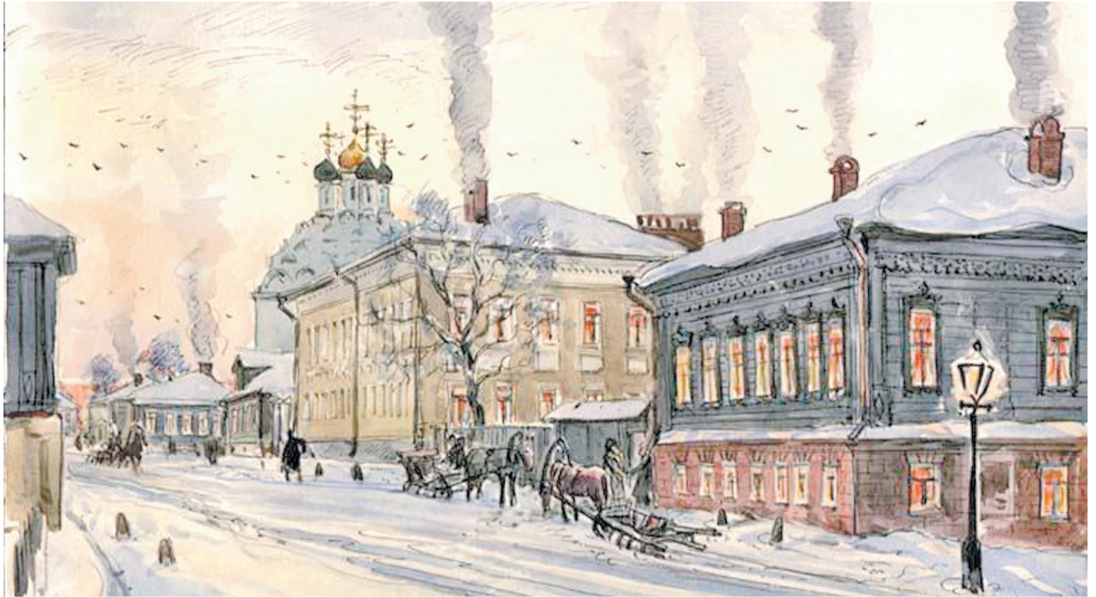
В странноприимном доме купца Щукина находили приют странники-богомольцы. Картина А. Федорова «Зимний вечер».

Дом № 26 на Посадской улице – один из примеров такой щедрости. Здесь находили временный приют паломники-богомольцы со всей России. Дом был небольшой: наверху располагались спальни и кельи для молитв, внизу – трапезная, кладовые, умывальники и пристроенная к дому уборная. Надпись над входом в дом гласила: «Господь спа-