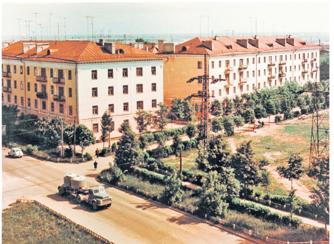
▶ ПЕРЕКРЕСТОК Окского пр-та и ул. Дзержинского, середина 60-х.