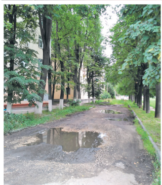
Современное фото: Александр ВИТИН