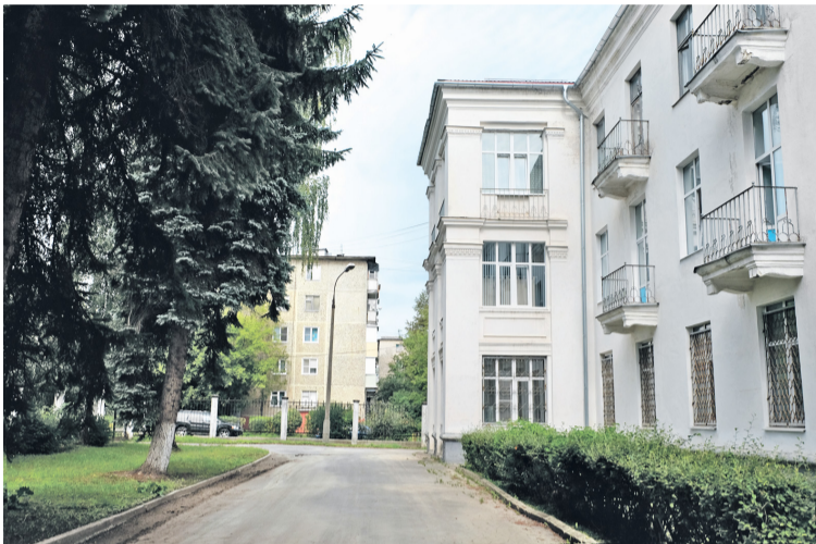
⬅ А вот как выглядит это место сегодня, спустя почти 70 лет.