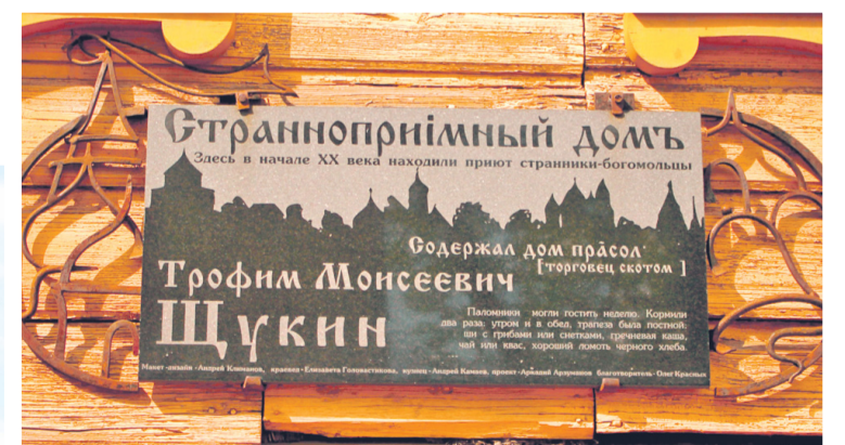
Сегодня дом № 24 на ул. Посадской является объектом культурного наследия РФ.