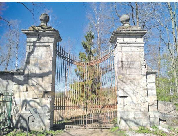
КАМЕННЫЕ ЗВЕРИНСКИЕ ВОРОТА ведут в парк Зверинец из Дворцового парка. Парк Зверинец был спроектирован еще при графе Орлове. В Зверинце содержались животные, предназначенные для императорской охоты: зубры, волки, медведи, кабаны и сотни оленей.