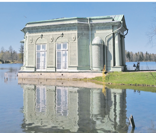
ПАВИЛЬОН ВЕНЕРЫ на острове Любви на Белом озере. Павильон словно вырастает из воды, напоминая о рождении Венеры, богини весны, любви и красоты.