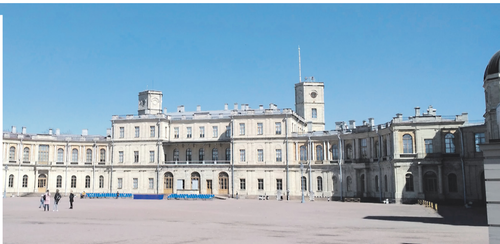
ПАМЯТНИК ПАВЛУ I на плацу перед Гатчинским дворцом.