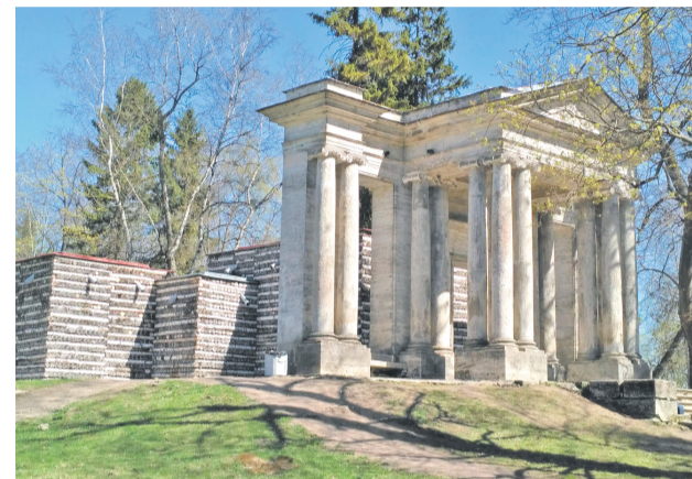
ПОРТАЛ «МАСКА» СКРЫВАЕТ БЕРЕЗОВЫЙ ДОМИК. Внешне строение имитирует поленницу березовых дров, не очищенных от коры, а внутри здания расположен изысканный зал с зеркалами, диванами и картинами. Павильон-сюрприз построен в середине 1780-х годов.

Для наибольшего погружения можно взять лодочную прогулку с экскурсоводом.