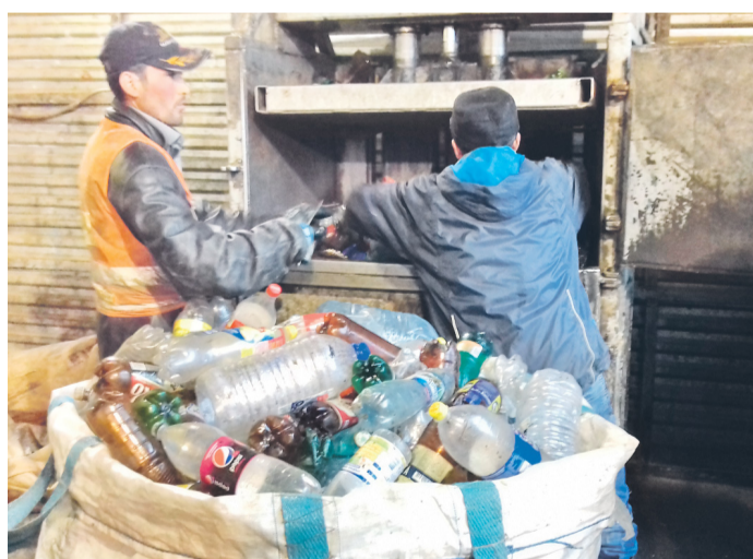
ПЛАСТИК , как рассказали журналистам, сортируют и прессуют прямо на полигоне «Воловичи». Затем его отправляют на переработку.