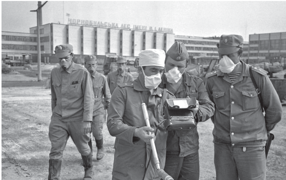
Многих из ликвидаторов катастрофы уже нет в живых.

Утром 27 апреля все газеты сообщили об аварии на ЧАЭС: «жертв и разрушений нет». Каждый