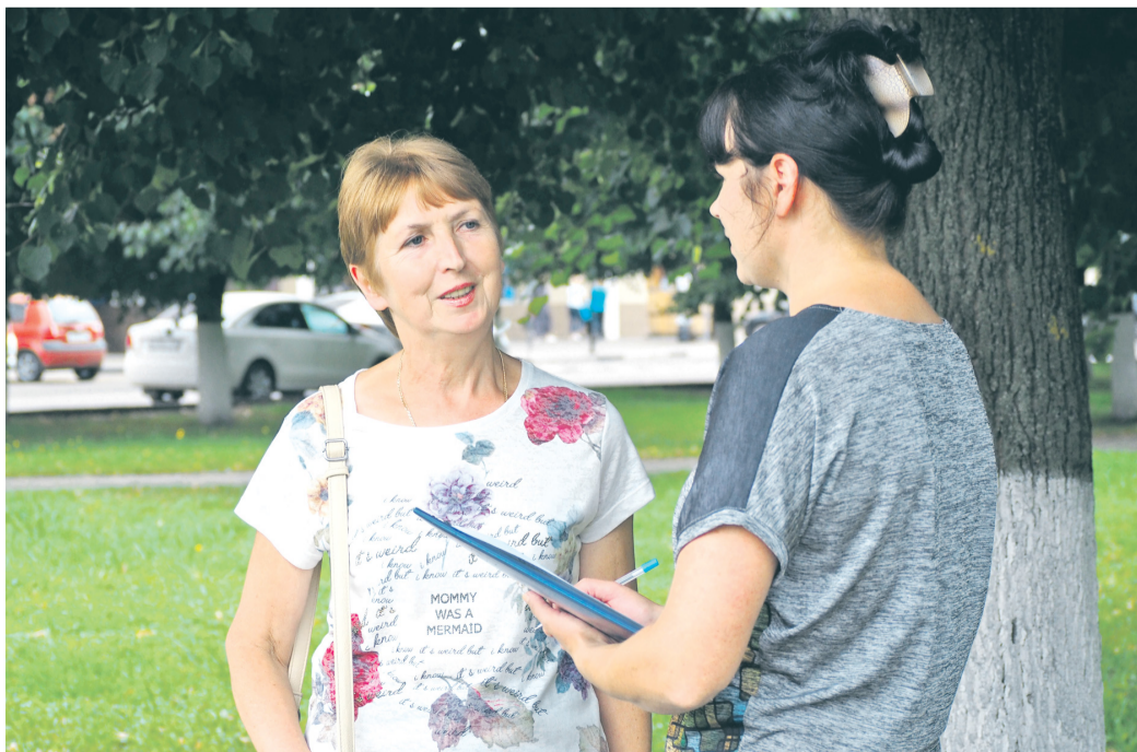
Опрос позволили изучить социально-политические настроения жителей городского округа Коломна и Коломенского района.

Обработка и анализ данных, полученных в ходе исследования, производились с использованием программ SPSS 19.0 и MS Excel.