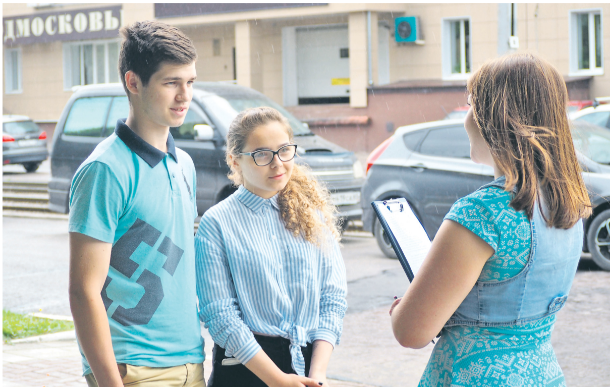
Коломенцы поделились с социологами своими политическими предпочтениями.

Как показывает практика предыдущих лет, очень важно, чтобы будущий Совет депутатов работал единой командой. Люди, которым предстоит принимать решения о дальнейшем развитии нового объединенного округа, должны смотреть в одну