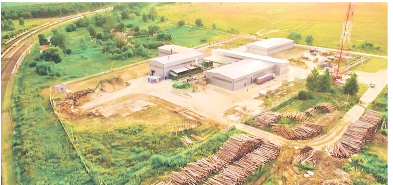
ИНДУСТРИАЛЬНЫЙ ПАРК «ЦЕНТР» действует в Коломенском районе три года. Это подготовленная территория площадью 35 га, расположенная в 65 км от МКАДа.

Председатель правления Внешнеторговой Германо-Российской палаты Матиас Шепп поделился личными впечатлениями: «Уважаемые дамы и господа, спасибо, что вы нас принимаете в Коломне. Коломна – мой любимый город в Подмосковье. В 90-х годах я часто приезжал к вам с женой, потом с детьми. У вас потрясающие люди, природа».